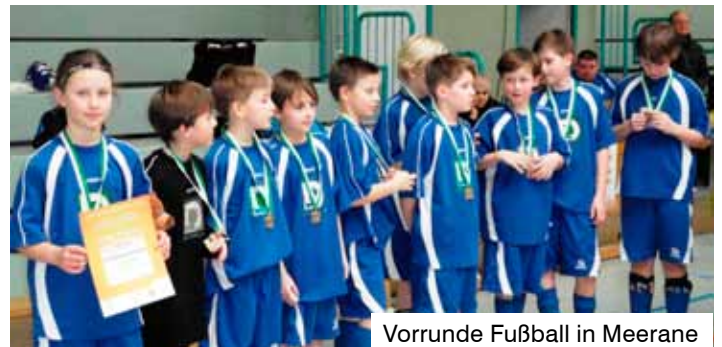
Vorrunde Fußball in Meerane