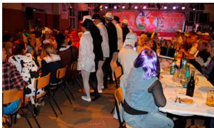
Einzug des Männerballetts in die neuen Räumlichkeiten

Über 1000 Stunden fleißige handwerkliche und gestalterische Arbeit zählte man allein in der unmittelbaren Vorbereitungszeit des Events. Schließlich sollte die Sportstätte für eine knappe Woche zur Faschingshochburg werden. Mehr als 600 Faschingsfans (einschließlich Kinderfasching) haben das „Experiment“ angenommen. Die riesige Arbeit ist belohnt worden. Nun können die Sportler ihre Trainingsstätte wieder in Beschlag nehmen. Der