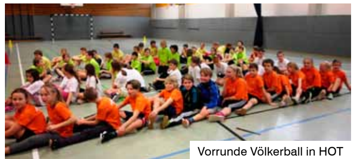
Vorrunde Völkerball in HOT

Vielen Dank für eure Einsatzbereitschaft und euren Kampfgeist! Ein großes Dankeschön für die Helfer.