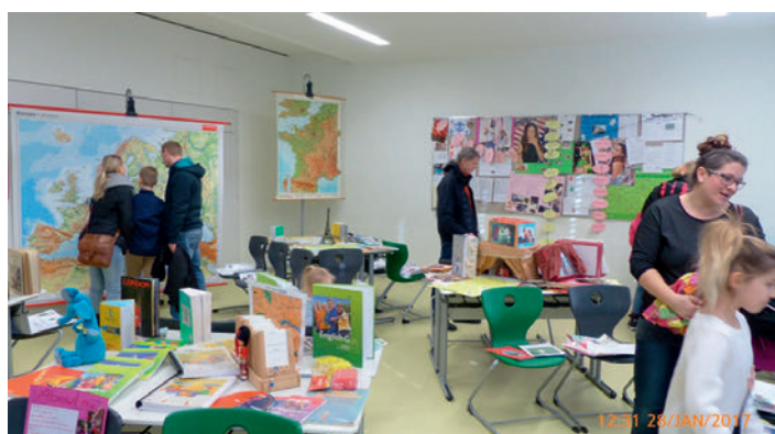
in den Fachräumen zum Tag der offenen Tür