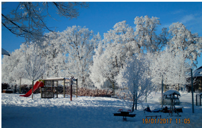
Winterliche Grüße von allen kleinen und großen Sonnenkäfern!

Was sind das für schöne Blumen am Fenster? Und wie schmeckt das weiße Zeug, was da vom Himmel fällt? Die Kinder staunen und genießen diese tolle Jahreszeit.