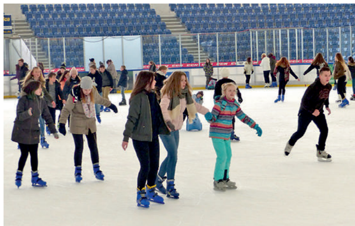
beim Wintersporttag in der Chemnitzer Eissporthalle