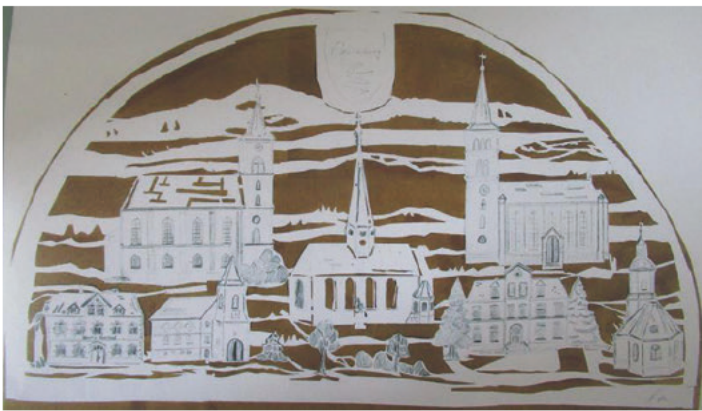
Entwurf des Schwibbogens

An Ideen mangelte es uns nicht, aber eine ließ uns fortan nicht mehr los. Ein Schwibbogen aus Metall, 4x2m groß, mit indirekter LED-Beleuchtung und Plexiverglasung, das wäre doch toll. Ein weihnachtliches Motiv kam nicht infrage, soll der Bogen doch ganzjährig strahlen. Es soll ein Zeichen der Einheit unserer sieben Ortsteile sein sowie ein würdiges Symbol für das 20jährige Bestehen unserer Gemeinde Callenberg. Unsere Wahl fiel schließlich auf die markantesten Gebäude eines jeden Ortsteils, genauer gesagt die Kirchen von Callenberg, Grumbach, Langenberg und Langenchursdorf, die Falkener Kapelle, die Kulturelle Begegnungsstätte von Reichenbach sowie Geylers Gasthaus in Meinsdorf. Im Hintergrund sind die Langenberger und Reichenbacher Höhe sowie der Stausee Oberwald zu sehen.