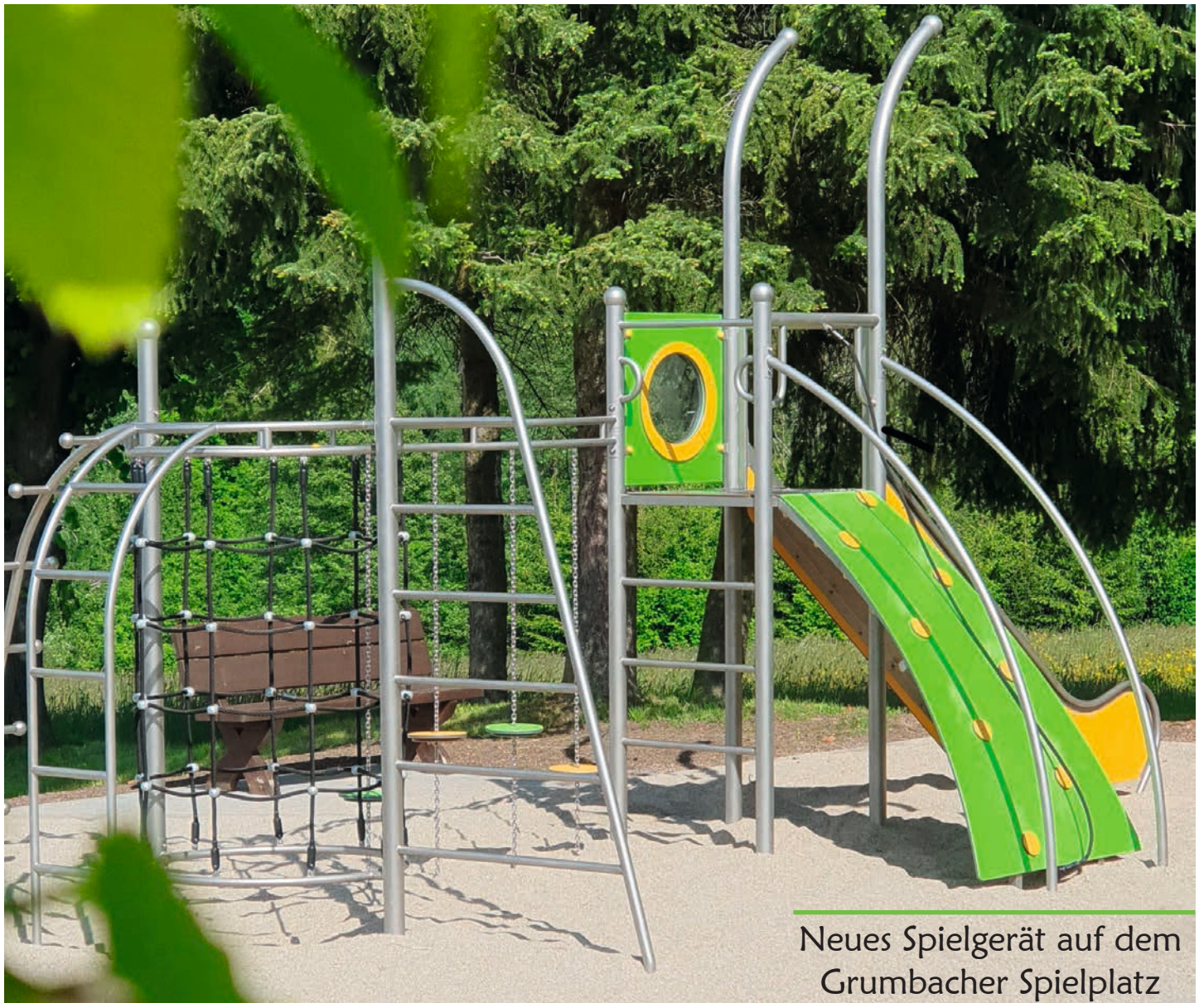
Neues Spielgerät auf dem Grumbacher Spielplatz