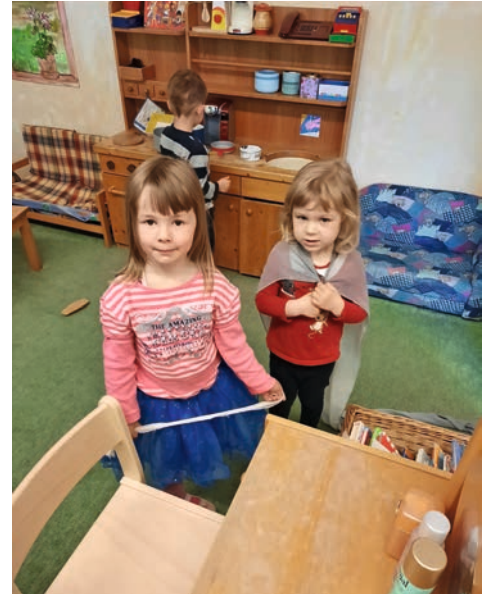
Mit freundlichen Grüßen Klein und Groß aus dem Langenchursdorfer Märchenland