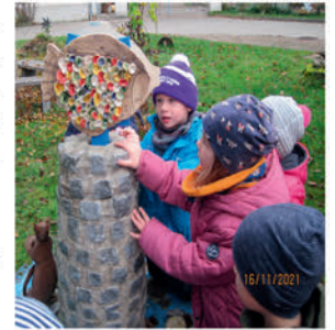
Klein und Groß aus dem Langenchursdorfer „Märchenland“

Förderverein „Märchenland in Ritterhand e.V.“ Waldenburger Straße 77, 09337 Callenberg OT Langenchursdorf