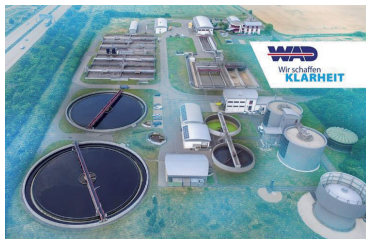
Bild 1: Auf der Autobahn A 4 aus Richtung Chemnitz kommend an der Abfahrt Glauchau-Ost kaum zu übersehen, die große Kläranlage in Remse OT Weidensdorf. Dort kommt es also an, das Toilettenwasser

Zuhause, beim Betätigen der Toilettenspülung denkt kaum jemand darüber nach, was mit dem Heruntergespültem passiert. Ehrlich gesagt, will das auch kaum jemand wissen. Wenn nicht, sollten Sie hier aufhören zu lesen. Wenn doch, wird es interessanter als Sie denken.